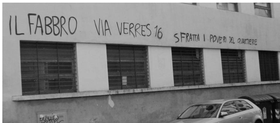
Le serrurier du 16 Via Verres expulse les pauvres du quartier.