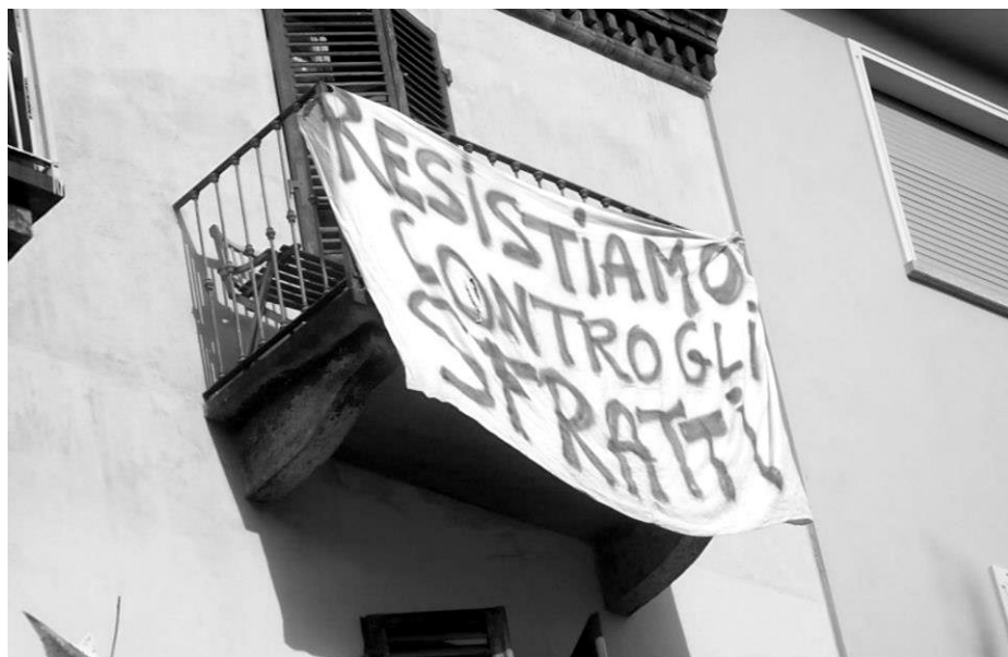
Résistons contre les sfratti. Via Soana, maison occupée le 22 juin 2012