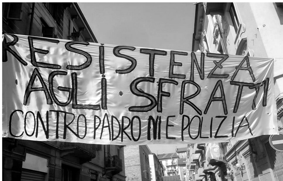
Résistance aux sfratti Contre les propriétaires et la police Banderole Via Barbania, un des piquets du 18 septembre 2012.