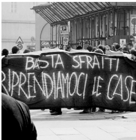
Basta sfratti! Reprenons les maisons. 8 mars 2012 manifestation lors de l'expulsion de la famille qui a résisté un an et quatre mois.

En un peu plus de six mois d'existence, l'assemblée a tout de même connu de notables évolutions. La stratégie de la "date unique" les a probablement accélérées. Aujourd'hui, des propositions plus offensives qu'il y a six mois nous n'aurions pas pensées possibles de faire à l'assemblée sont désormais portées par toutes et tous.