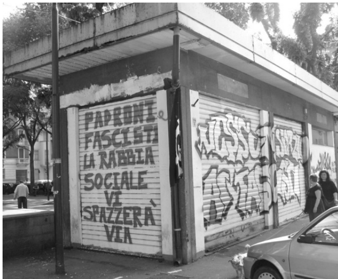
Propriétaires, fascistes, la rage sociale vous balayera. Pas de place pour les fascistes. En face du siège du parti des libertés (PDL, droite), via Montanaro.