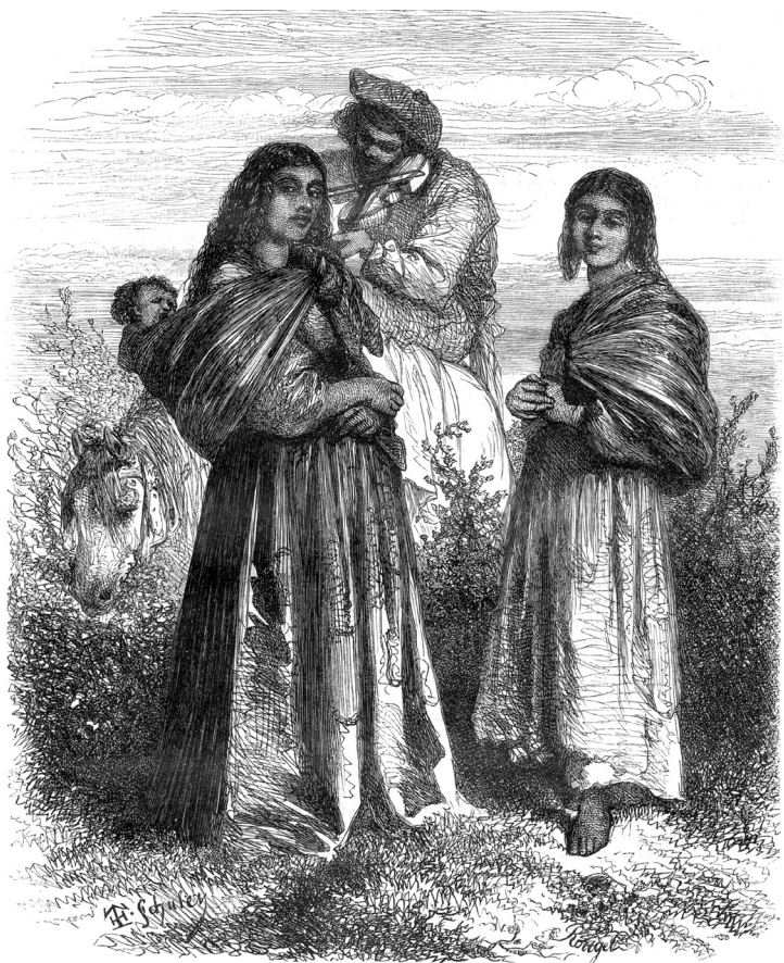
Famille de bohémiens du Barenthal (Moselle et Bas-Rhin). — Dessin de Th. Schuler.